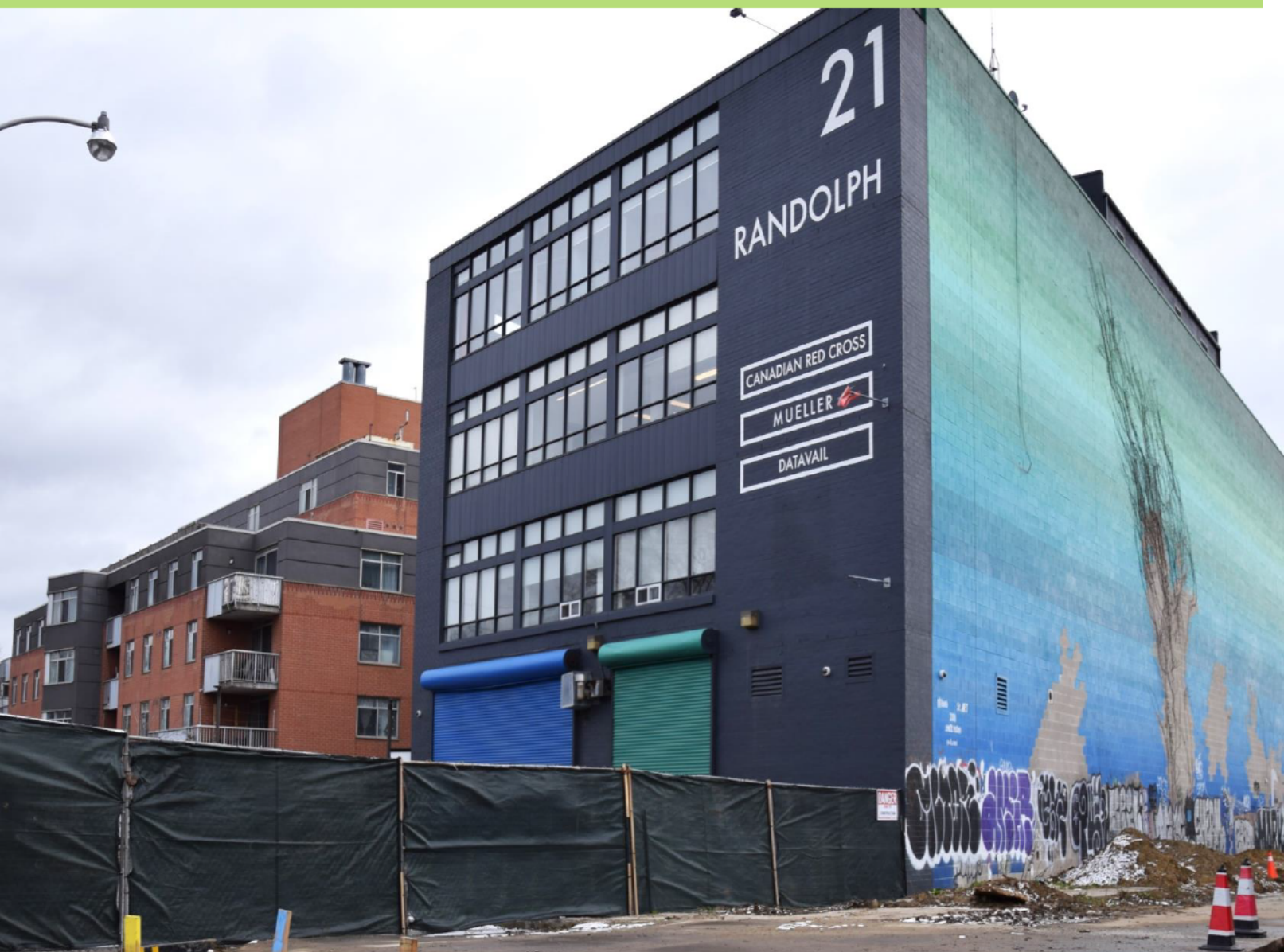
Site du futur bâtiment d'accès à l'avenue Randolph

CONSTRUCTION EN COURS POUR L'AJOUT D'UNE QUATRIÈME VOIE ET D'UNE NOUVELLE ENTRÉE : APPEL D'OFFRES POUR LE RACCORDEMENT À LA STATION DE MÉTRO