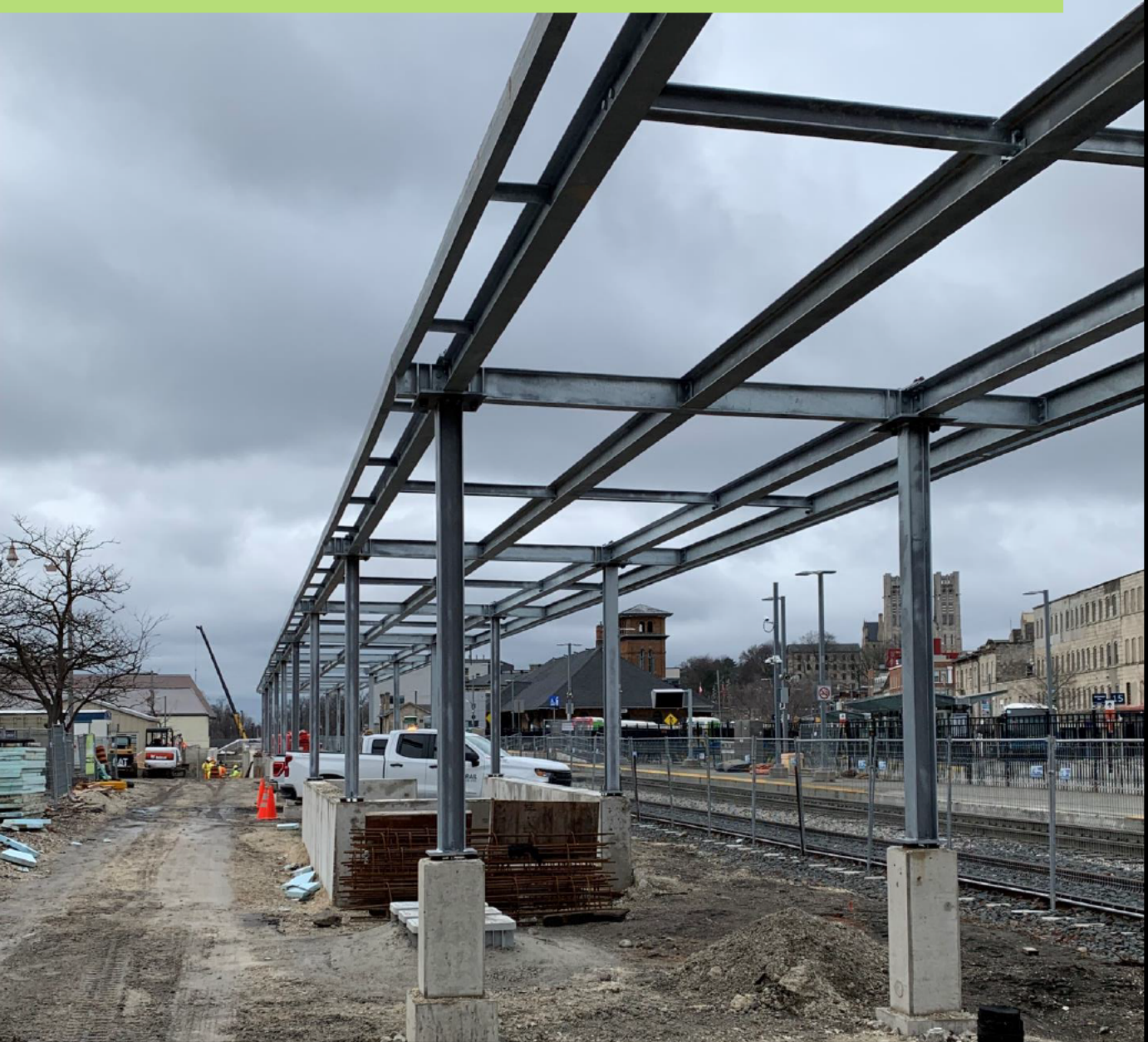
Installation de l'auvent métallique de la plate-forme en cours