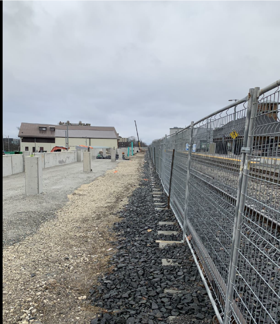
Une barrière temporaire le long d'une voie ferrée active