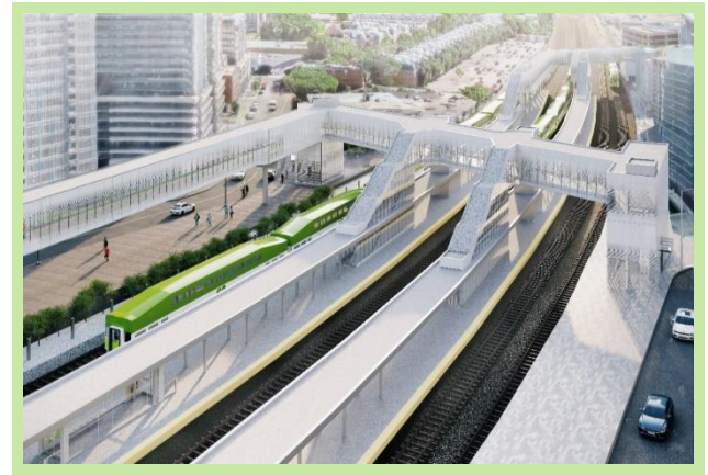
Figure 2 : Rendu d'artiste de la gare GO SmartTrack King-Liberty. Susceptible d'être modifié.

Aucun impact sur la TTC ou d'autres modes de transport en commun n'est prévu pendant ces travaux.