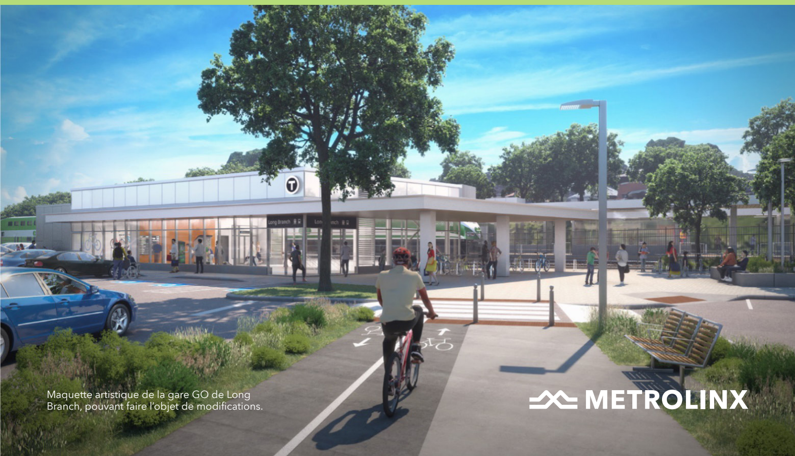
Maquette artistique de la gare GO de Long Branch, pouvant faire l'objet de modifications.

*Les dates sont provisoires et peuvent changer.