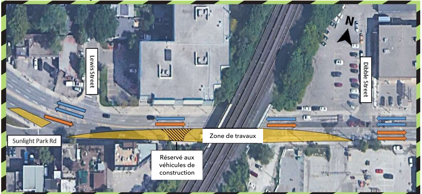
Figure 1 : Carte montrant la fermeture des voies en direction est, réduisant la circulation à une voie dans chaque direction.