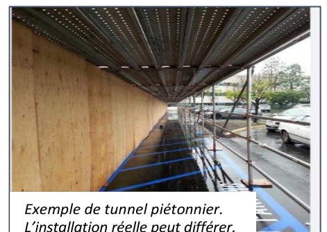
Exemple de tunnel piétonnier. L'installation réelle peut différer.