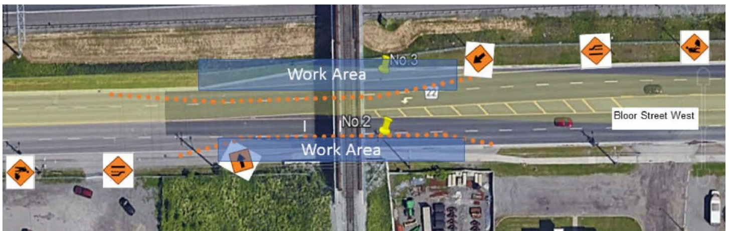
Rue Bloor Ouest (en direction est et ouest) Zone de travaux et fermeture de voies

À partir du 8 janvier et jusqu'en février 2024