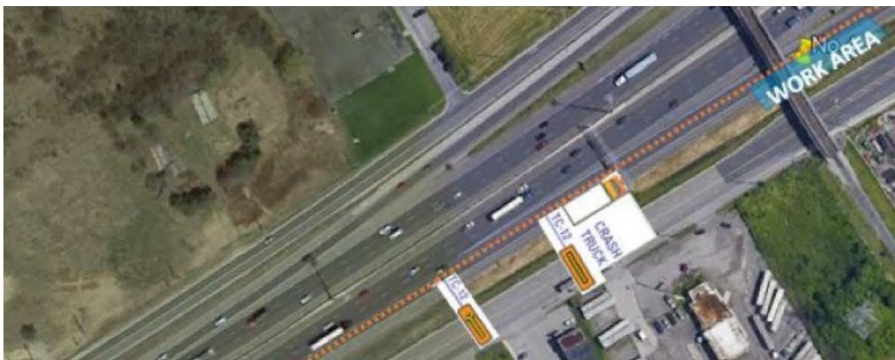
Fermeture de la voie de droite de la bretelle de sortie de l'autoroute 401 en direction est