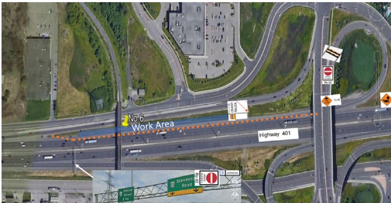
Fermeture de la bretelle de l'autoroute 401 en direction ouest (chemin Stevenson)

Cet avis de construction peut être traduit dans une autre langue sur demande en nous envoyant un courriel à DurhamRegion@metrolinx.com .