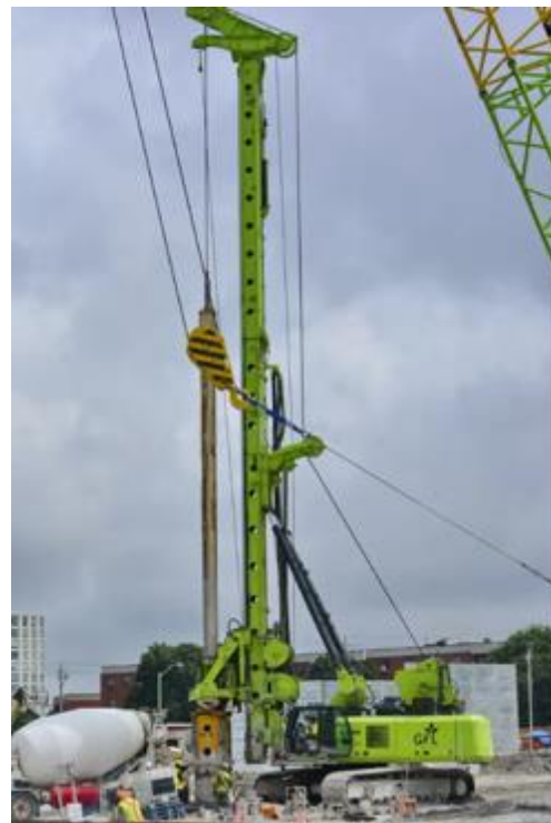
Exemple d'un appareil de forage