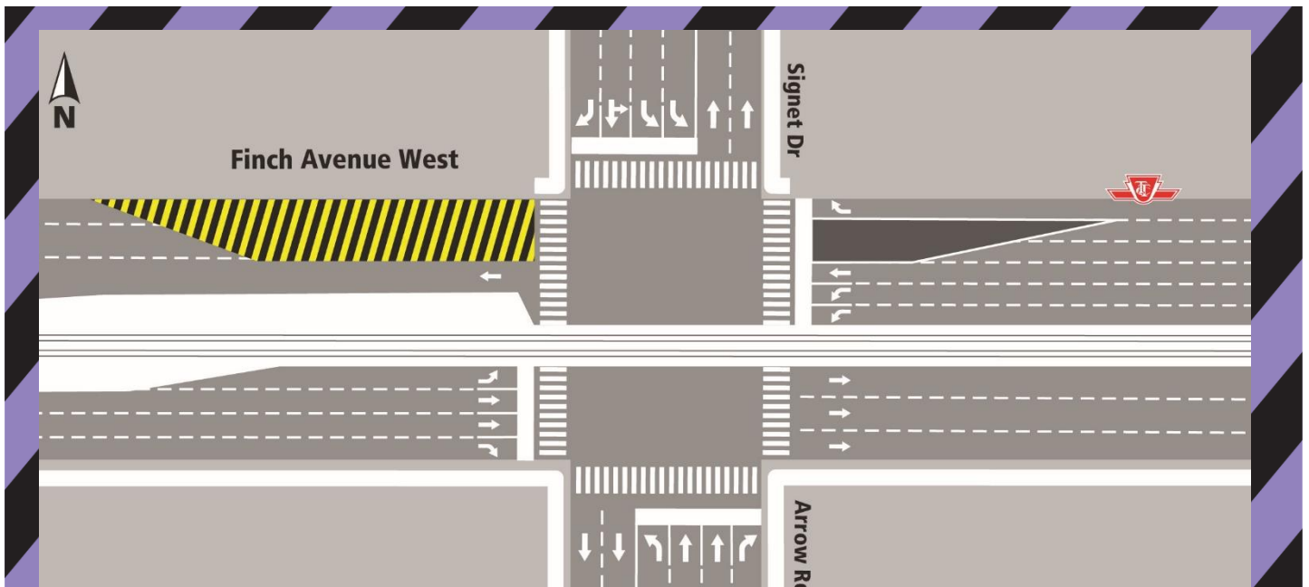
Description de la carte : Promenade Signet/chemin Arrow et avenue Finch O.