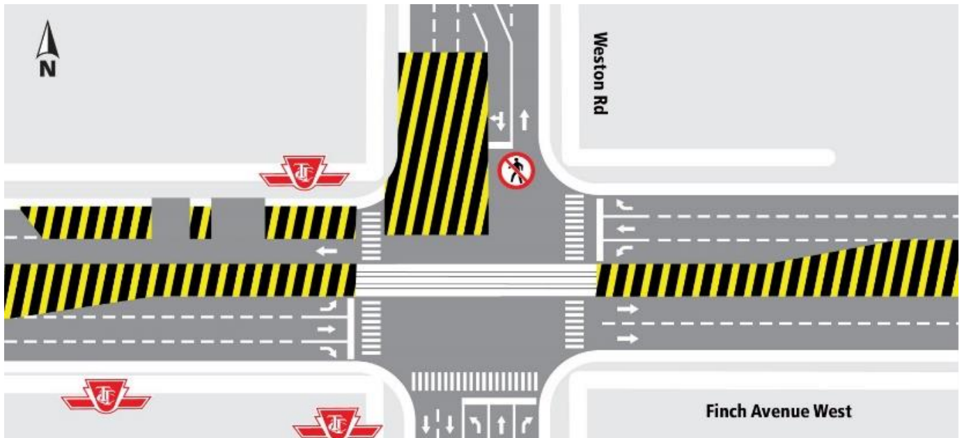
Description de la carte : Chemin Weston et avenue Finch Ouest.