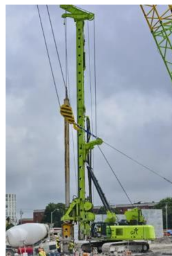
Exemple d'un appareil de forage à piles