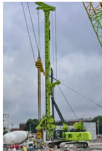
Exemple de plateforme de forage de