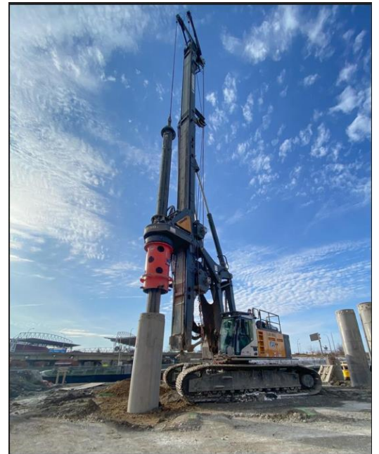
Exemple de plateforme de forage de pieux