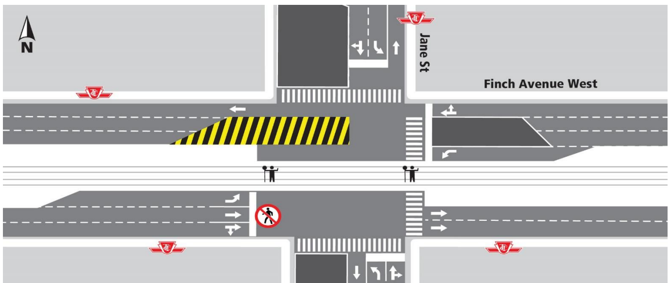
Description de la carte 2 : Rue Jane et avenue Finch Ouest. Travaux mineurs d'installation des services publics à partir

Le bruit et les vibrations seront surveillés, au besoin, pendant ces activités.