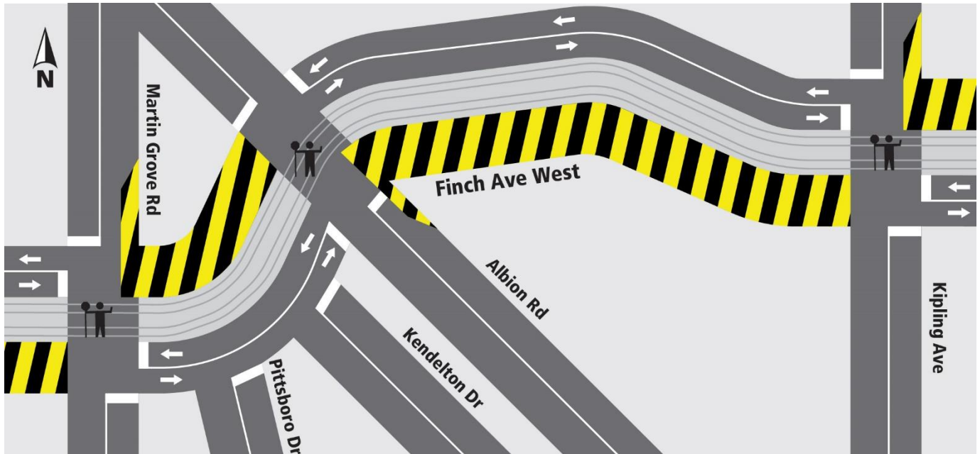
Description de la carte 2 : Pavage final à partir du 24 juin 2024, pendant quatre (4) semaines, environ.