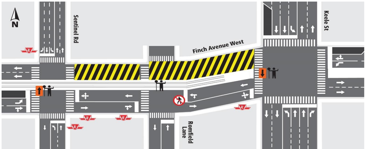
Description de la carte 2 : Du chemin Sentinel à la rue Keele. Travaux de fraisage commençant le 22 juin 2024 et dureront un (1) jour environ.

Le bruit et les vibrations seront surveillés, au besoin, pendant ces activités.