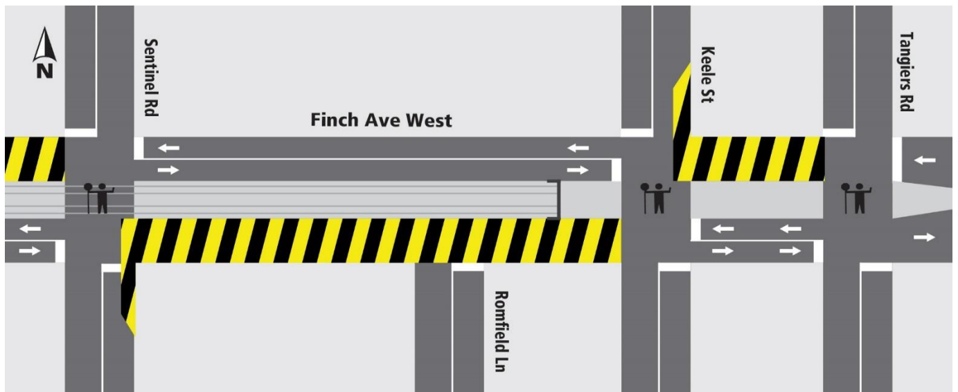
Description de la carte 2 : Entre le chemin Sentinel et le chemin Tangiers. Pavage final à partir du 24 juin 2024, pendant quatre (4) semaines environ.