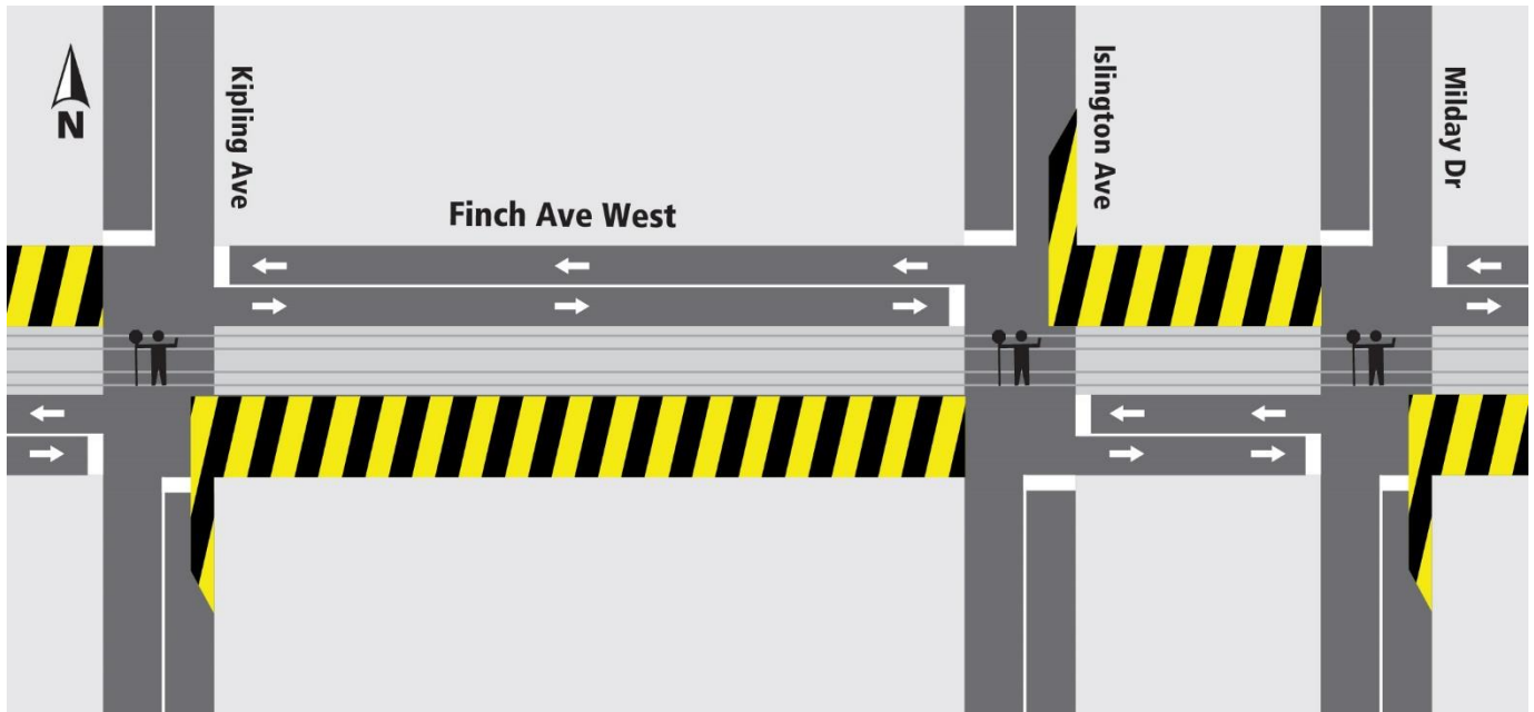
Description de la carte 2 : Pavage final à partir du 24 juin 2024, pendant quatre (4) semaines, environ.

Le bruit et les vibrations seront surveillés, au besoin, pendant ces activités.