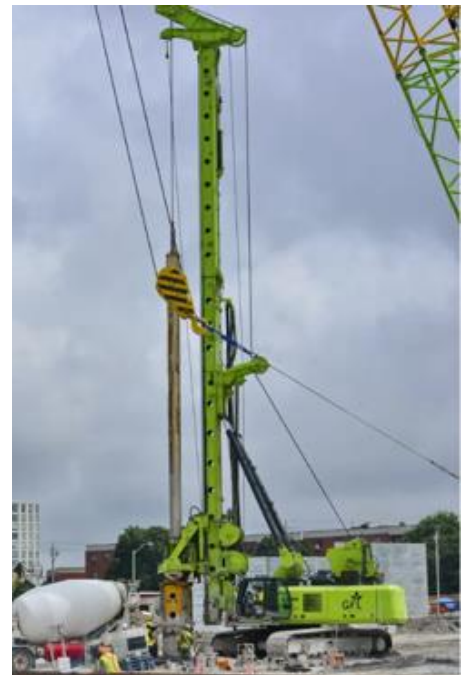
Appareil de forage à piles illustré ci-dessus