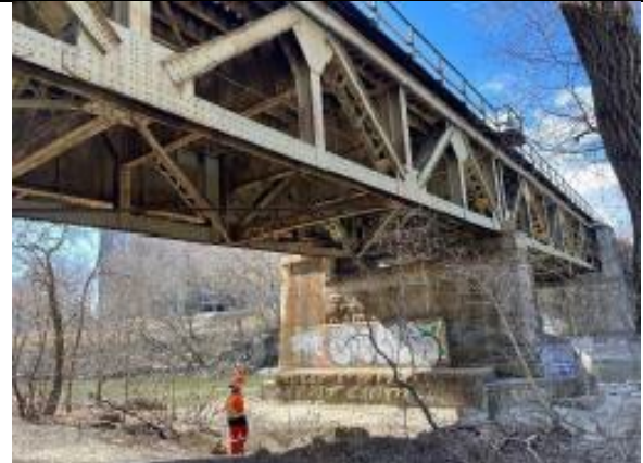
Pont du ruisseau Etobicoke - en face du sentier du ruisseau Etobicoke, faisant face au parc Maurice J. Breen