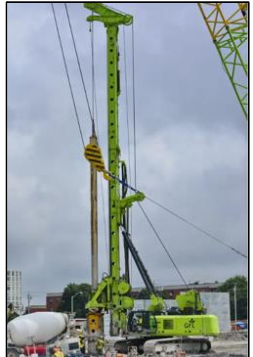
Exemple d'appareil de forage à pieux