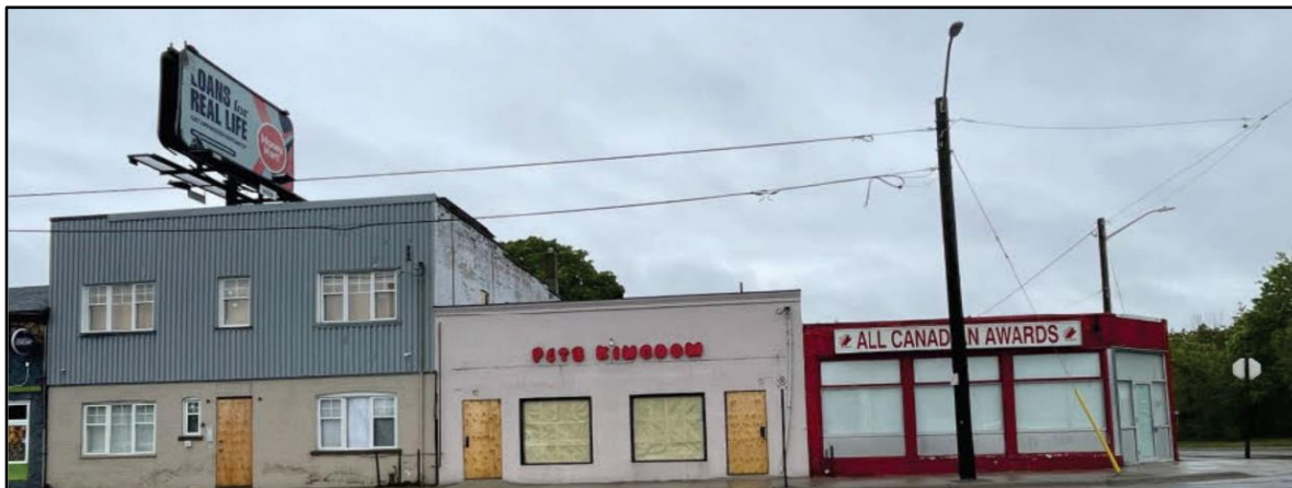
Figure 1 – Aperçu de la démolition des bâtiments