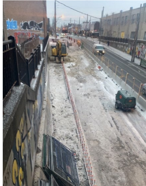
N° 2 Démolition du trottoir sur la rue Dupont (côté ouest)

Activité terminée n° 3 : Construction d'une route d'accès temporaire et mise en place de barrières de chantier près du croissant Turntable et du chemin Davenport (terminé en janvier 2026)