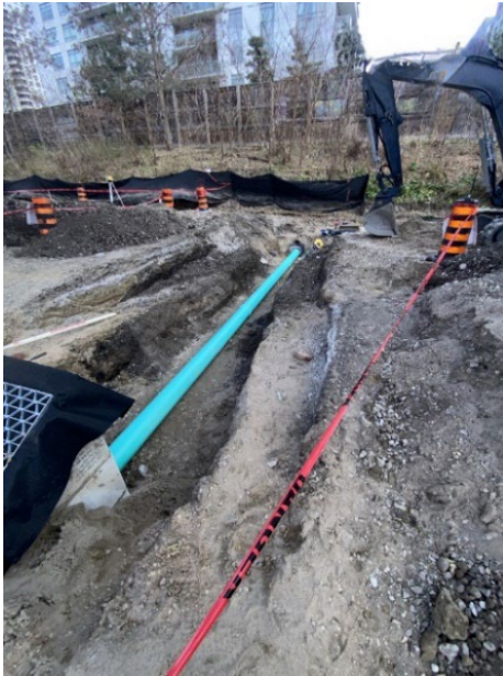
N° 1 Travaux de drainage et de voirie dans le corridor

Activité terminée n° 2 : La démolition du trottoir actuel de la rue Dupont a commencé en novembre 2025