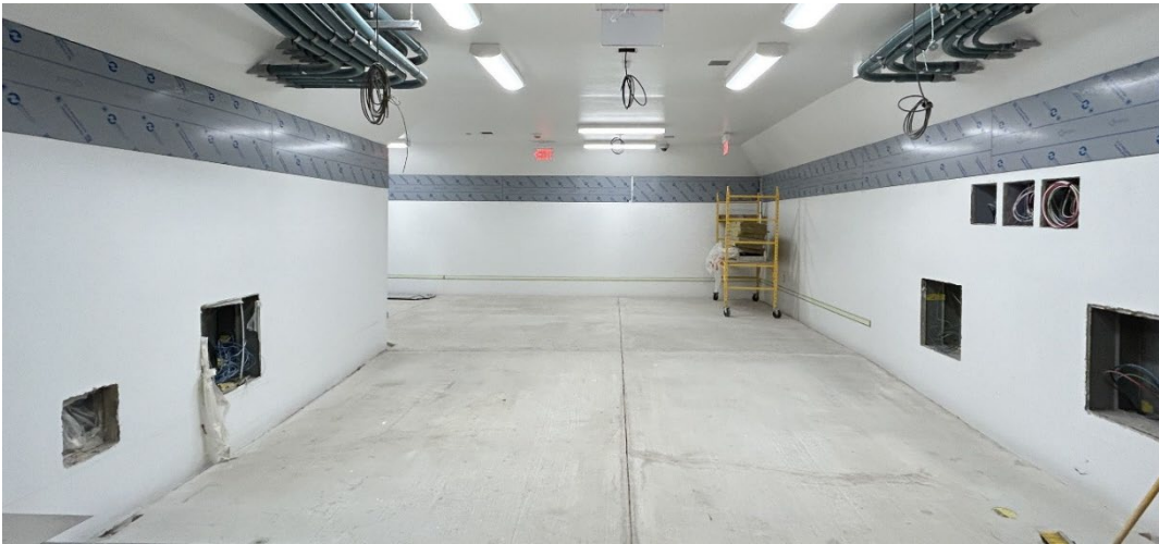
Figure 2 : Nouveau pavillon/tunnel piétonnier au bout de l'avenue Randolph

Les systèmes de distribution électrique, de CVC, de plomberie, d'éclairage et de sonorisation seront testés et réglés afin de s'assurer que tous les composants fonctionnent correctement.