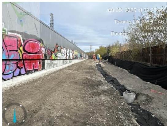
#1 Travaux dans le corridor près du parc Davenport Village