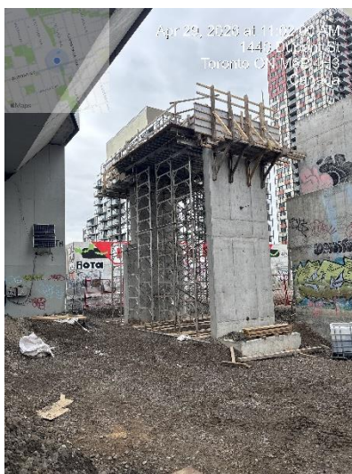
#2 Construction de la culée du pont piétonnier près de la rue Dupont