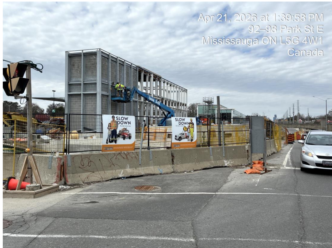
Gare de Port Credit