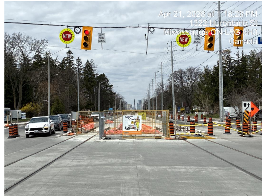
Mineola et Hurontario